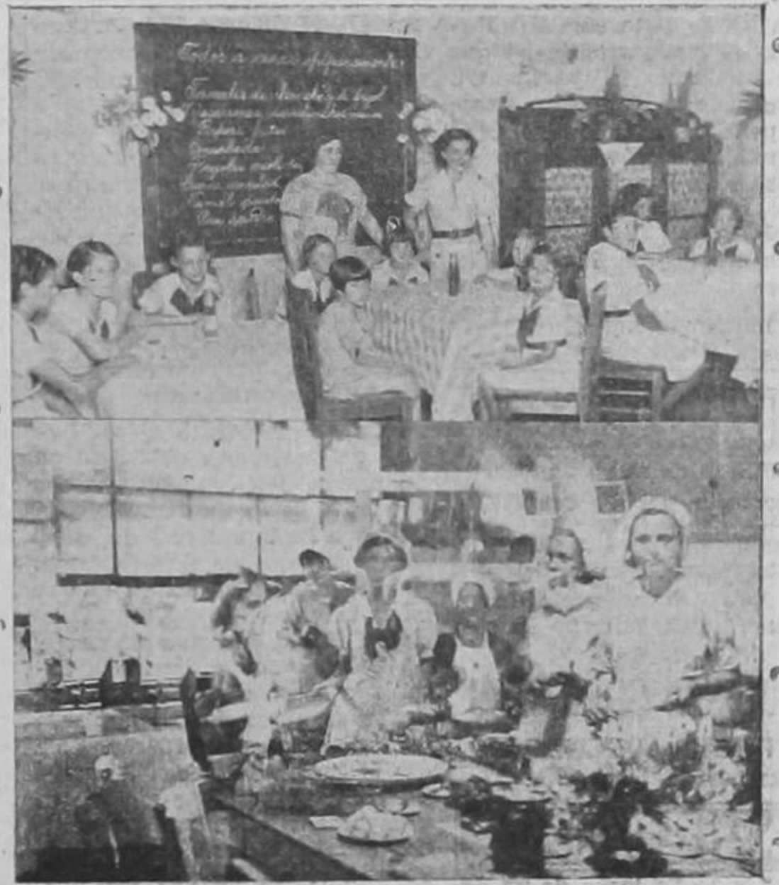
Muestra la composición gráfica dos aspectos de la Feria Escolar que se celebró, durante el sábado y domingo, en la escuela "García Flamenco" de esta capital.—Parte superior: mesitas donde se servía al público toda clase de golosinas; abajo: grupo de simpáticas alumnas quienes prepararon las ctnas.